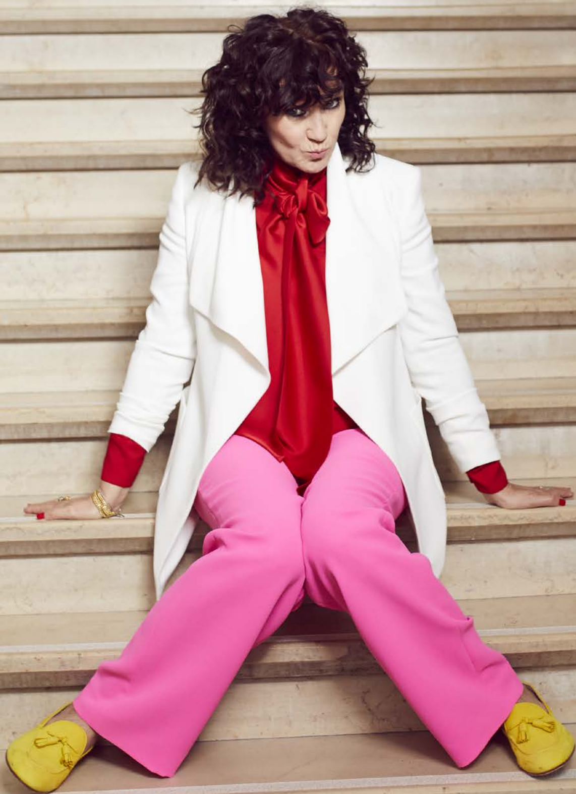
Strikblouse (La Dress), broek (Natan), witte blazer (Scada), schoenen (Guess).