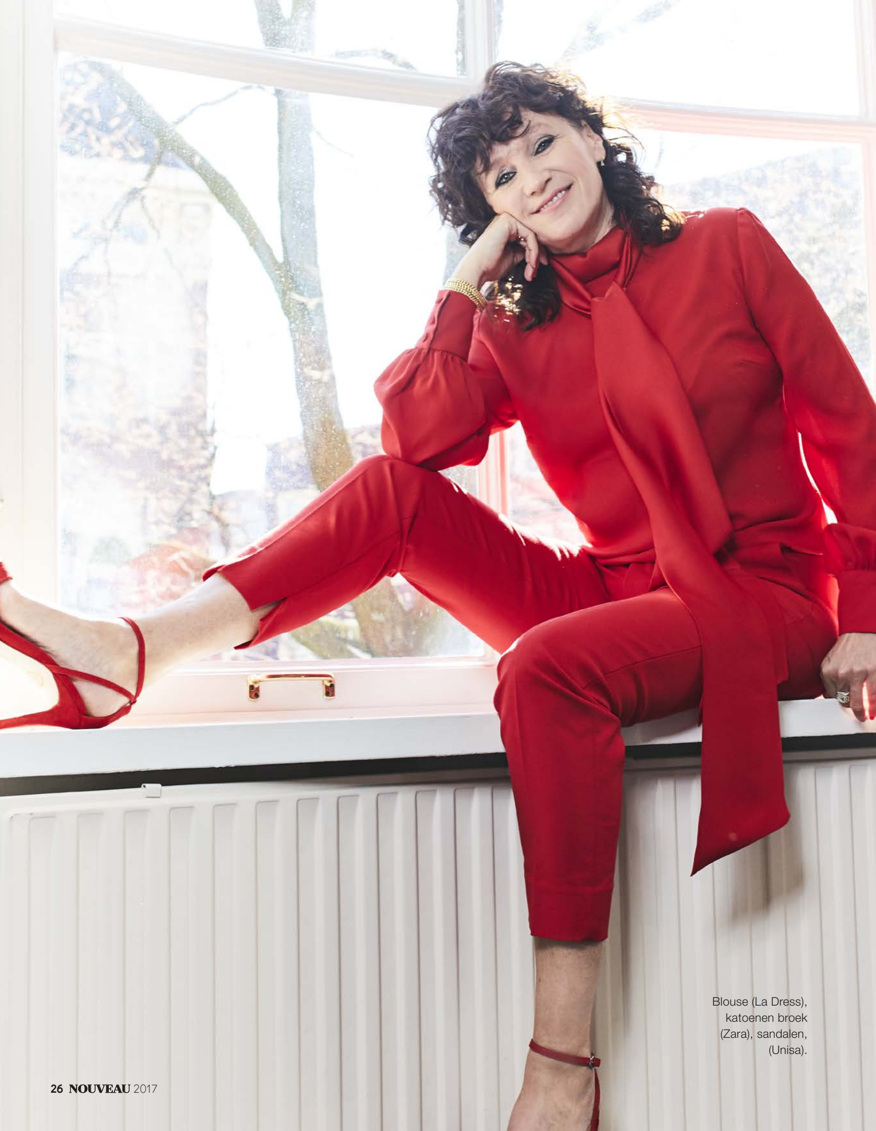
Blouse (La Dress), katoenen broek (Zara), sandalen, (Unisa).