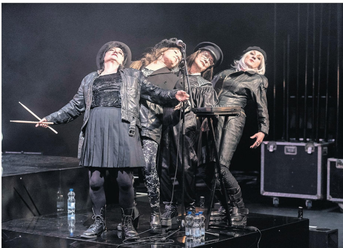
Scène uit 'Zwaar metaal'.